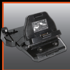
Station d'accueil pour chariot