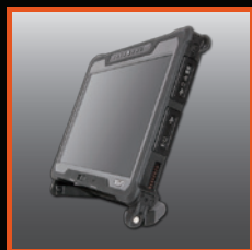
A140 avec poignée rigide multifonction servant de béquille