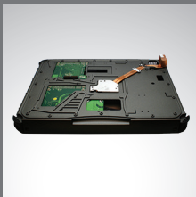
PCI/PCI-Express 3.0 Unité d'extension