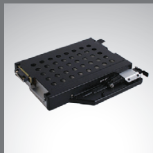
Baie multimédia 2ème stockage 2ème batterie